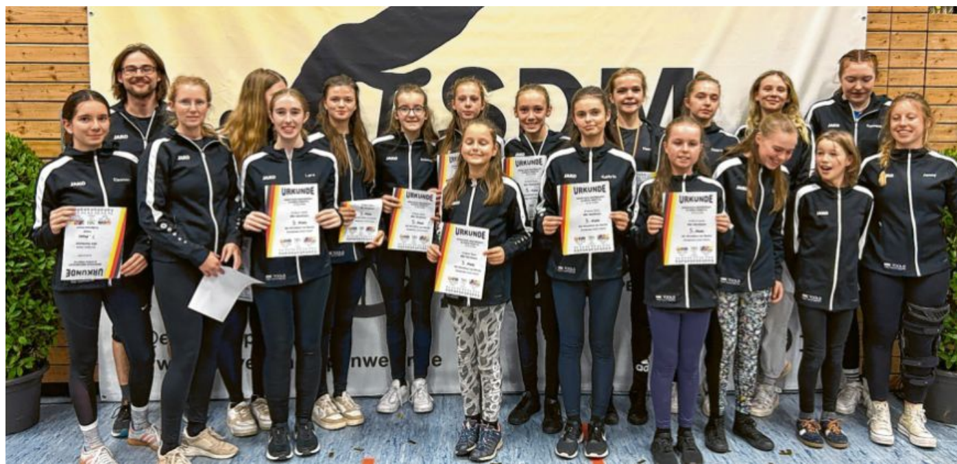
Gruppenbild der Teilnehmerinnen des Radsportvereins Illertissen an der Süddeutschen Meisterschaft – gekleidet in den neuen Trainingsjacken.